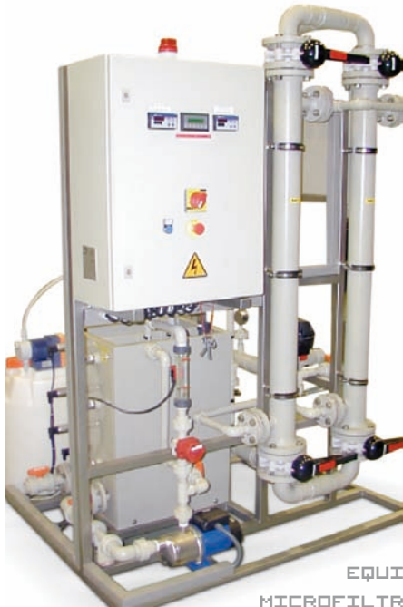
EQUIPO DE MICROFILTRACIÓN PILOTO