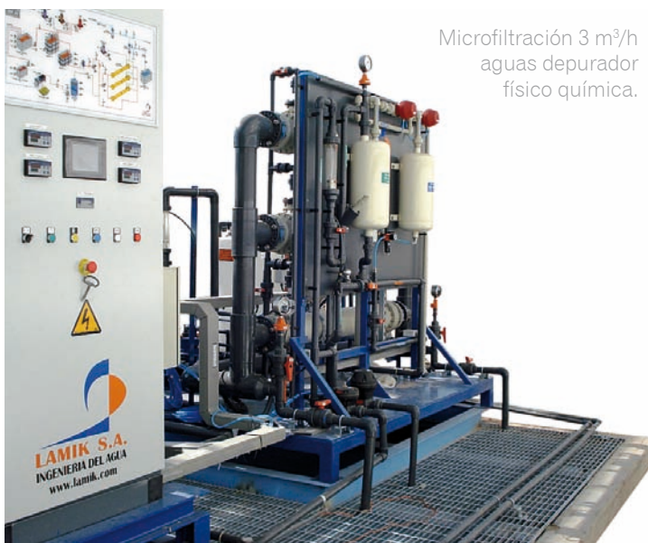
Microfiltración 3 m 3 /h aguas depurador físico química.

Son plantas depuradoras compactas, automáticas y de fácil manejo que permiten realizar filtraciones en continuo.