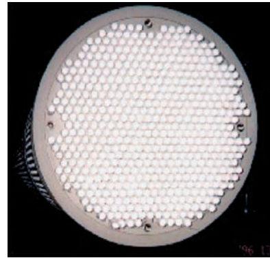
MÓDULO DE MEMBRANAS MD150TP2

Son plantas depuradoras compactas, automáticas y de fácil manejo que permiten realizar filtraciones en continuo.