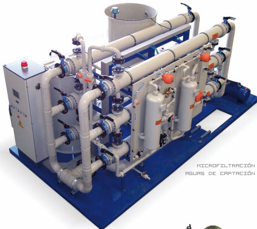
MICROFILTRACIÓN AGUAS DE CAPTACIÓN

Los equipos de membrana "MF / UF" están concebidos para permitir la separación sólido líquido de aguas de producción y captación respectivamente.