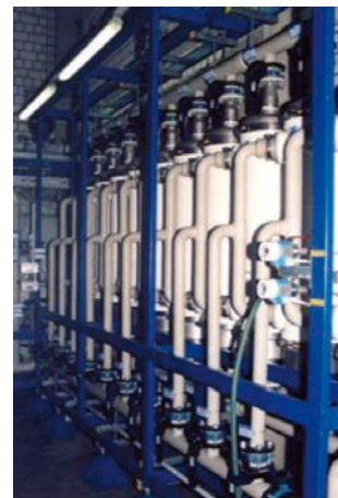
Ultrafiltración aguas de captación de río. (15.000 L/H)